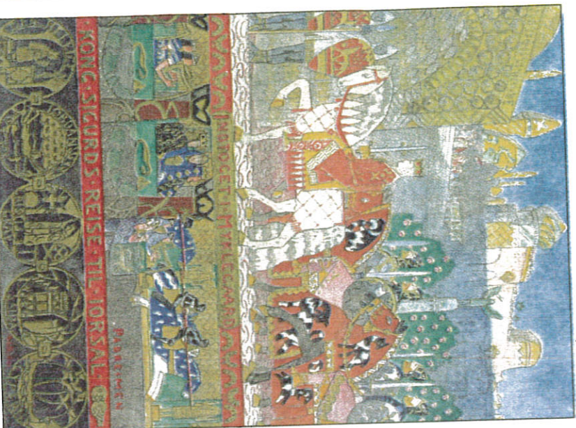
NORRØNT: Muntthe henter inspirasjon fra det norrønte til sine dekorative arbeider. Her hans «Sigurd Jorsalfar. Inntoget i Myklegård» fra 1899.