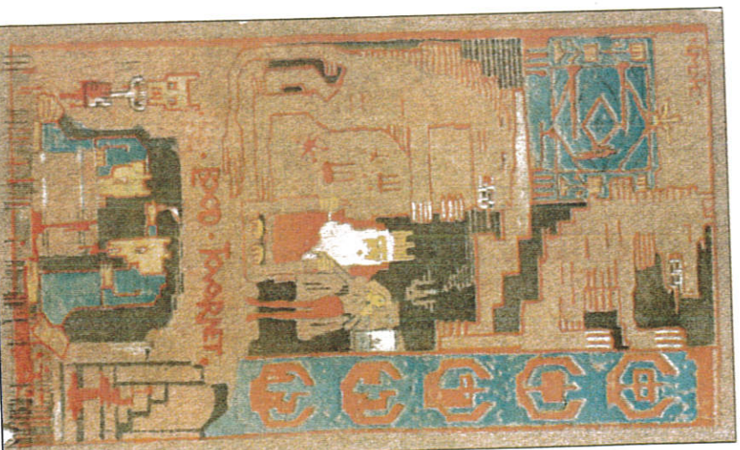
TIL VEV: Flere av Muntthes malerier ble brukt til sine dekorative arbeider. Som hans «Blod-tårnet» fra 1891.