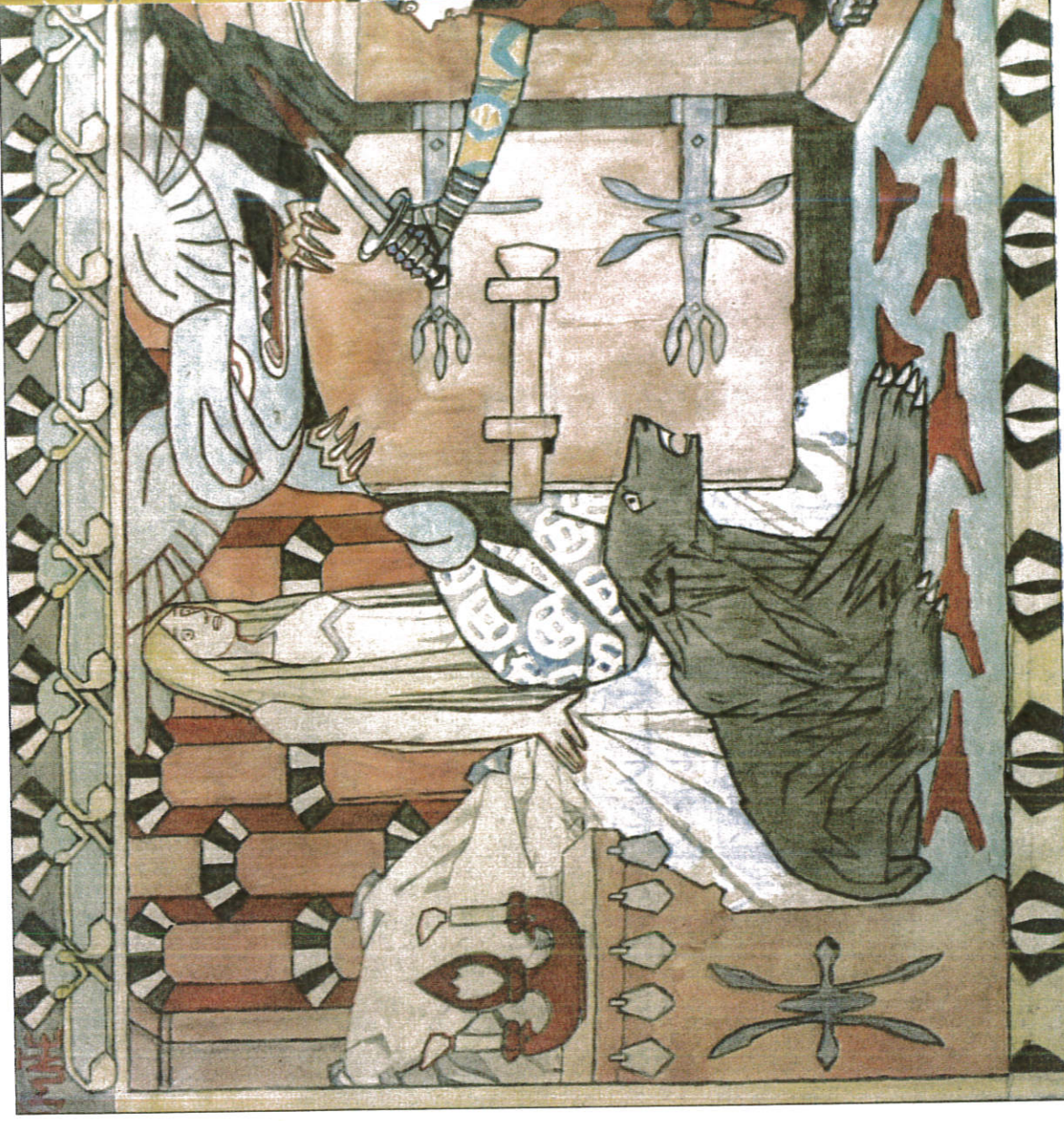
HISTORIE: Den ornamentale rammen rundt et felt som forteller en historie, peker mot bruken av arbeidene som mønstre for veggmaleri og tepper. Her «Blodtårnet» (1907).

Bruken av store fotopaneler i utstillingen deler inn det korridoraktige hovedrommet i avsnitt som viser dekorasjoner som i ettertid er gått tapt. Ikke alt virker like vellykket. Spesielt er Munthe problematisk som utstillingsdesigner.