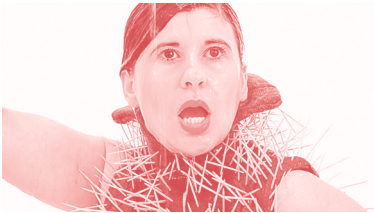
2012, video, 4'04", dokumentasjon av performance.

Kunstneren bærer en drakt med 4000 tannpikere, som skyter ut fra kroppen hennes når hun skifter mellom ulike positurer, og stikker henne i de mest krevende bevegelsene. Kaktusen blir en kraftfull og komisk metafor for å være kvinne, og Ekici viser oss både skjønnheten og begrensningene hos denne hardføre planten som kan vokse under de mest ugjestmilde forhold. Ekici bruker ofte sin egen kropp i kunsten sin, som ofte handler om tilhørighet, språk, religion og identitet.