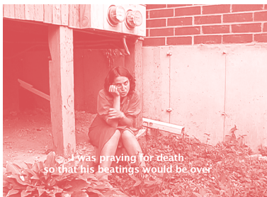
2007, video, 6'47".

Eğrikavuk arbeider ofte med fiktive tolkninger av hendelser som like gjerne kunne skjedd i det virkelige liv. I denne fortellingen forkledd som dokumentar møter vi Gül, en ung kvinne som er offer for tvangsekteskap og vold. Samtalen med Gül blir stadig avbrutt av scener der skuespilleren snakker utenfor manus, diskuterer troverdigheten til karakteren hun spiller, og snakker om hvordan stereotypier og oppfatninger om vold mot kvinner oppstår. Med bakgrunn fra journalistikk, litteratur og performance, sjonglerer Eğrikavuk med virkelighet, myter, fakta og fordommer, og spør oss hva vi aksepterer som sannheten.