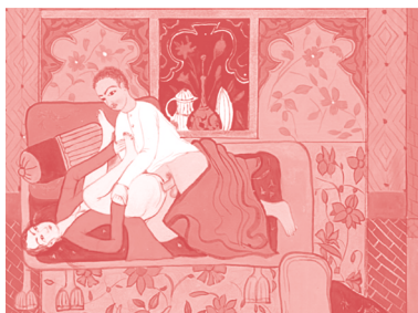
2009, videoanimasjon, 27'30".

Med en blanding av ottomansk miniatyrmaleri, gamle familiefotografier og egne tegninger illustrerer CANAN fortellingen om hvordan normer og leve-regler overføres fra en generasjon til den neste. Exemplary er som et moderne eventyr, og handler om en kultur i endring, i møtet mellom frie, sekulære verdier og en konservativ kultur med vekt på religion og moral. Ved å fokusere på enkeltmenneskers skjebne gjør CANAN dette til en personlig historie om forholdet mellom mødre og døtre, og utforsker ideen om at det personlige også er politisk.