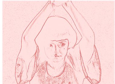
2014, installasjon / tablet, 45'.

En kvinne fanget bak en vegg av glass prøver desperat å tiltrekke seg oppmerksomhet for å bli sluppet ut. Plassert i en dekorativ gullramme blir hun til et objekt, noe som kan eies og henges opp på veggen. Rammen skaper avstand mellom kvinnen og oss på utsiden, som blir øyenvitner til hennes fangenskap, uten å kunne hjelpe. Asals filmer kjenne- tegnes av et dokumentarisk språk og et sterkt sosialt engasjement.