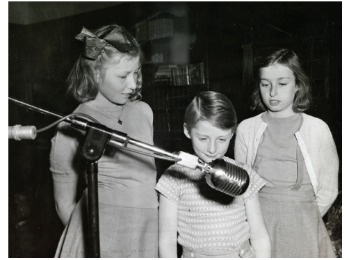
Prinsessene Ragnhild og Astrid og Prins Harald spiller inn julehilsen til norske barn i 1942, Pooks Hill, USA