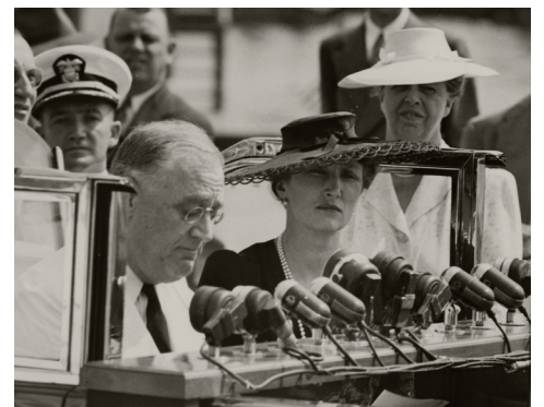
President Roosevelt holder talen "Look to Norway" 16. september 1942