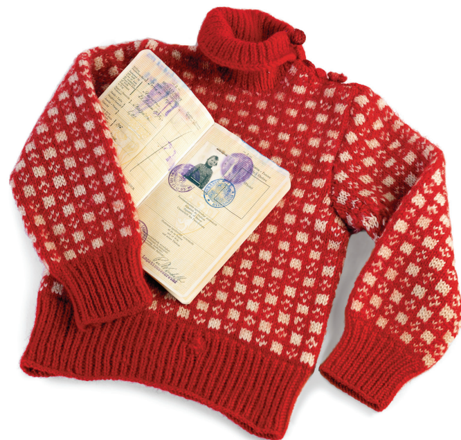
Prins Haralds genser fra flukten i 1940, passet ble utskrevet underveis