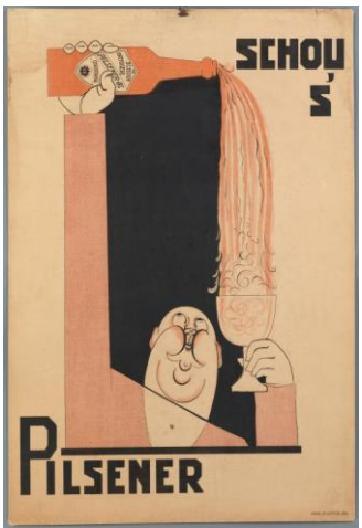
Per Krohg «Schou's pilsner» ca. 1920