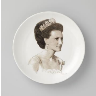
Ukj.kunstner «Kronprinsesse Sonja» Figgjo 1972