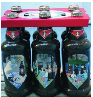
Ingrid Askeland «Private property» 2005