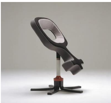
Peter Opsvik «Balans femini» Stokke 1982