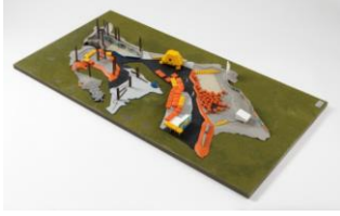
Helen og Hard AS «Geopark i Stavanger (modell)» ca. 2010