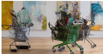
Etter Ida Ekblad (fototapet) «Ida Ekblad i MfS» 2013