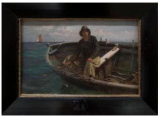
Hans Gude «Fisker fra Rügen» 1882