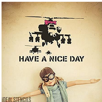
Etter Banksy (sjablong) «Happy choppers» Ideal UK 2016