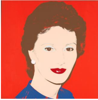
Andy Warhol «Portrett av Kronprinsesse Sonja» 1982