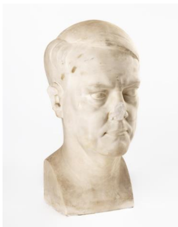
Wilhelm Rasmussen «Portertt av Vidkun Quisling» 1943