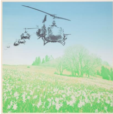
Per Kleiva «Blad fra imperialismens dagbok II» 1971