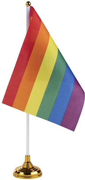
Etter Gilbert Baker «Rainbow Flag» 1977 (2017)