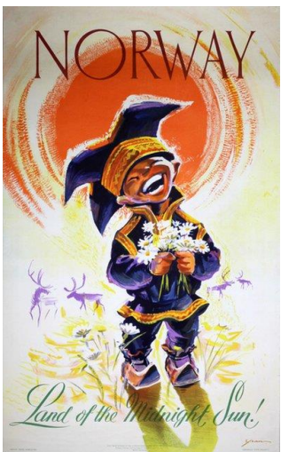
Knut Yran «Norway-Land of the Midnight sun!» 1959