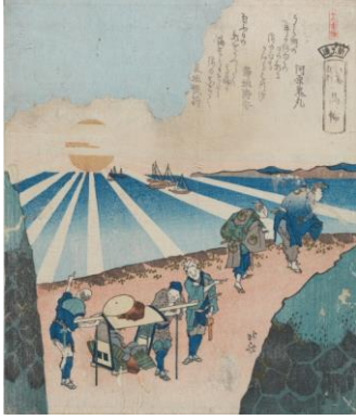
Totoya Hokkei «Reiseskildringer fra Ejima» 1833