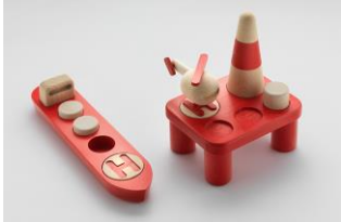
Permafrost «Off Shore» 2013