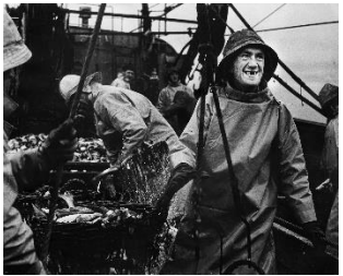
Kåre Kivijärvi «Fra de store banker» 1959