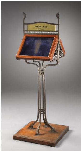
Ukj.kunstner «Monter fra Verdensutstillingen i Paris» 1900