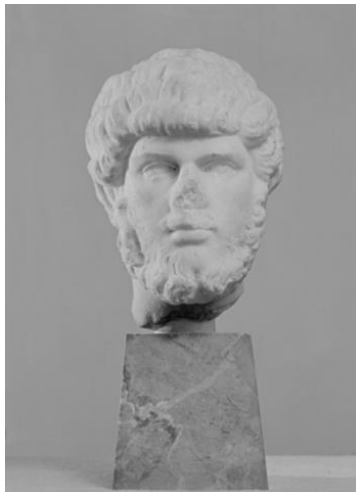
Ukj. kunstner «Portrett av Lucius Verus» ca.170 e.Kr.