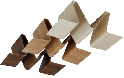
Papermaster, magasinbord (2001)