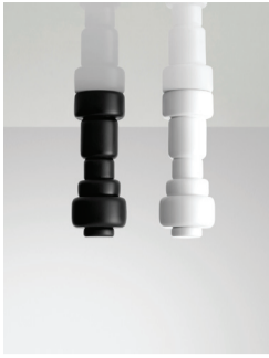
PLUS, salt- og pepperkverner (2008)