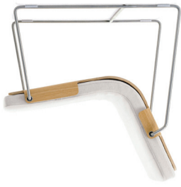
Pancras, stol (2002)