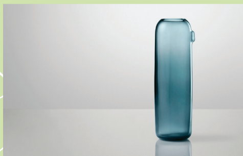
I am BOO, karaffel (2006)

Formidlingsmateriell: Ole Høeg Gaudernack